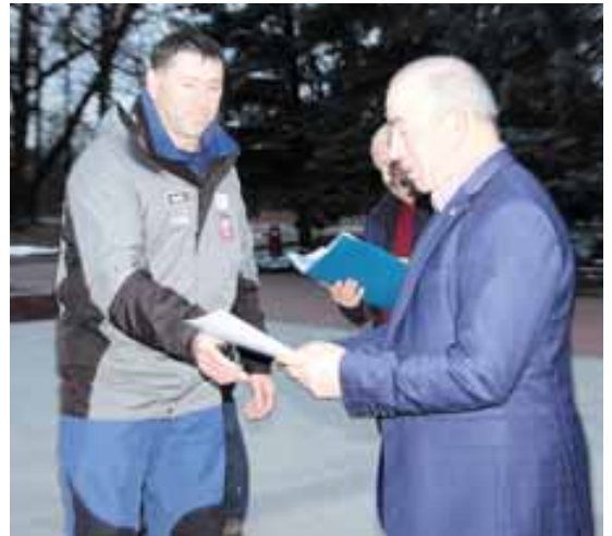
Аккайланы Азнауурга Ёлмезланы Абдул-Халим грамотаны бередиле.

- Ата журтну кьоруулаучусуну кюннун бошдан белгилемейдиле. Аны керти да чынтты эр кишиле кьоруулайдыла. Сиз а жылны къыш