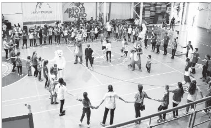
17 сентября в спортивном комплексе «Гладиатор» прошло яркое спортивное мероприятие для детей с ограниченными возможностями здоровья