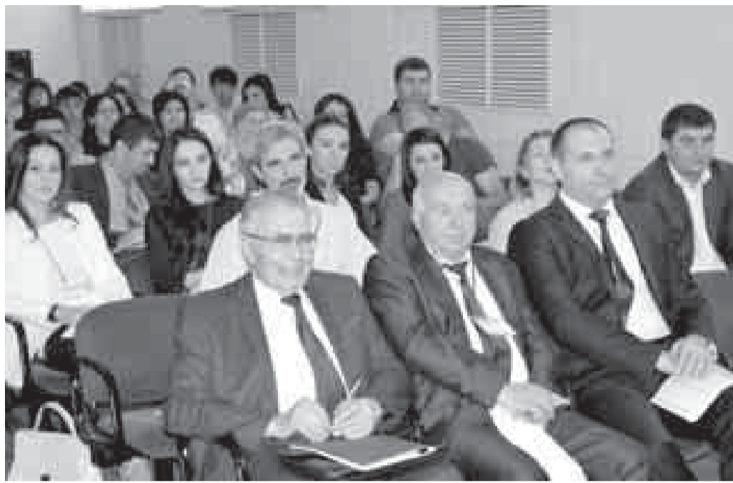
В мероприятии приняли участие представители научных сообществ, высших учебных заведений и общества промышленников и предпринимателей республики. В рамках мероприятия прошла выставка инновационных проектов

В Нальчике в Институте информатики и проблем регионального управления Кабардино-Балкарского научного центра РАН состоялись сессии практического консалтинга, организованные в партнёрстве с Российской венчурной компанией.