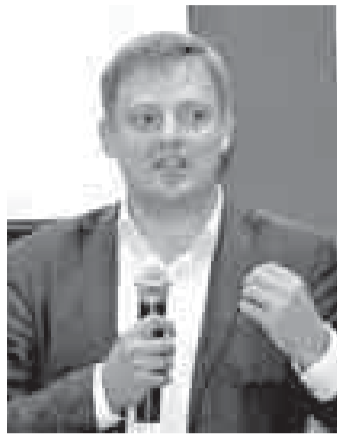
в области робототехники и систем автоматизации. Участники встречи отметили актуальность и значимость проведённых региональных сессий практического консалтинга в качестве эффективного инструмента подготовки и повышения квалификации представителей инновационных компаний, научного сообщества, вузов, специалистов и инвесторов, получения ими мирового опыта и приобщения к международным стандартам в области создания бизнеса, привлечения финансирования, патентования.