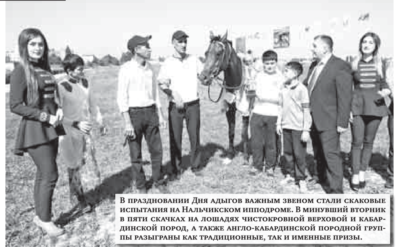
В праздновании Дня адыгов важным звеном стали скаковые испытания на Нальчикском ипподроме. В минувший вторник в пяти скачках на лошадях чистокровной верховой и кабардинской пород, а также англо-кабардинской породной группы разыграны как традиционные, так и именные призы.