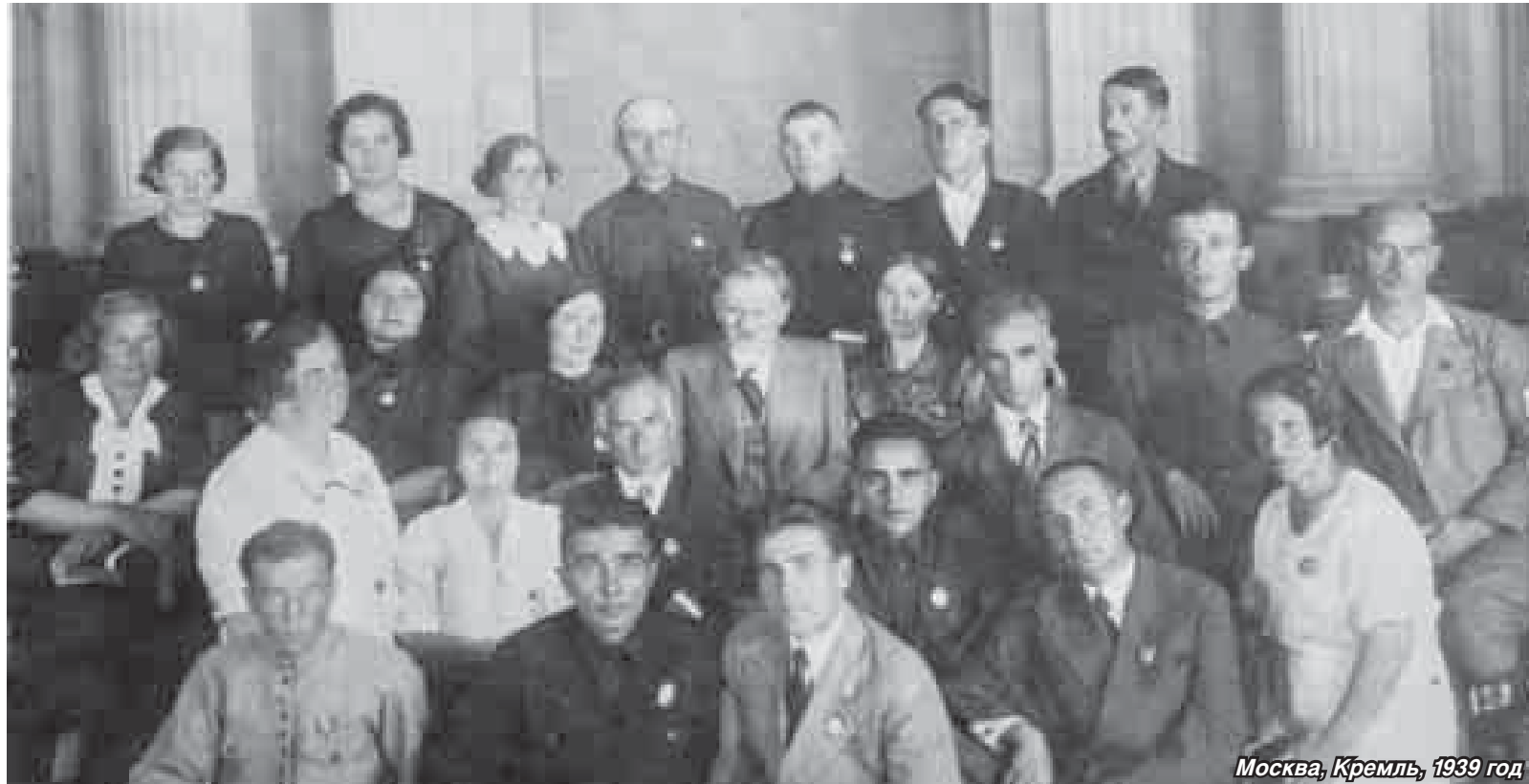
Москва, Кремль, 1939 год