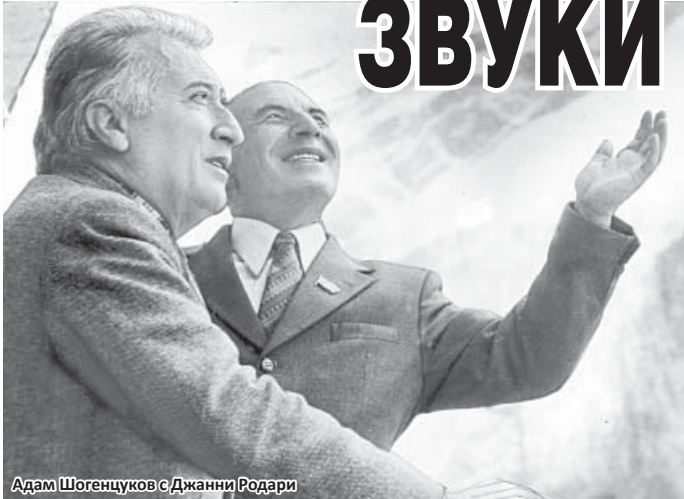
Адам Шогенцук с Джанни Родари