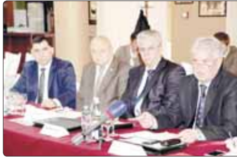
• Дунейсо Адыгэ Хасэ