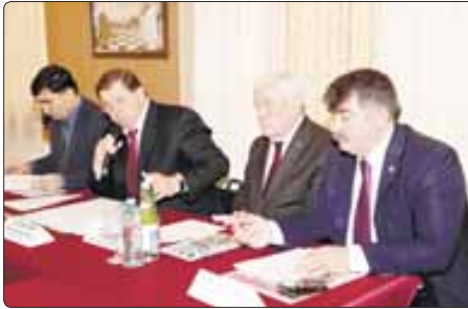
Ди газетын зэрэгтатаци, Налшык кыал шекулакша Дунейсо Адыгэ Хасэм и Гэзэщэцкэ гүлпм и зи чэу зэуцшэ. Абы хэтэц Туркүм, Иорданнем, Сирием, Адыгэй, Кэзэрдей-Балькэр республиккэм, Ставрополь, Краснодар крайхэм шыгэ Хасэ кыдаэмкэм ялыкыуэхэр.