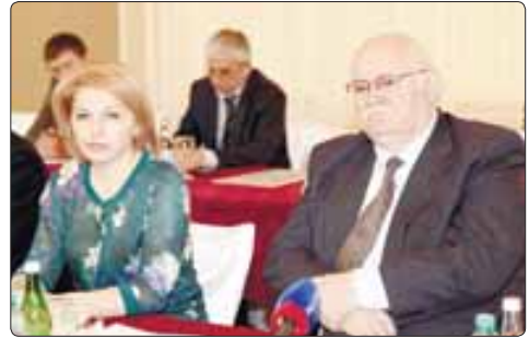
Машбашэ Исхэжэ кыдыкүлэтей шэблэм едрэцкыуэх, ахуэдгэзэн зэрхуейр.