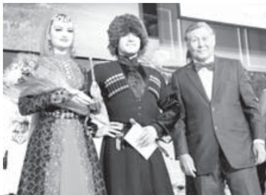
Кыазахстанда Гран-при алган кезиуде.