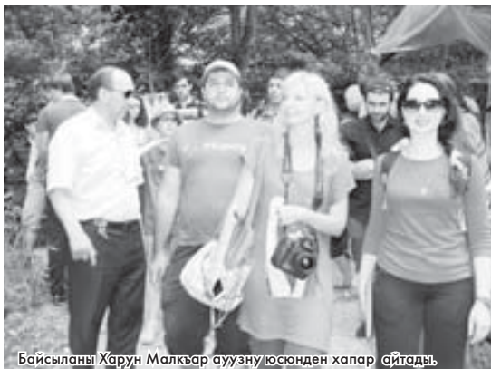
Байсыланы Харун Малкъар ауузу юсюнден хапар айтады.

ХОЛАЛАНЫ Марзият. Суратланы автор алгъанды.