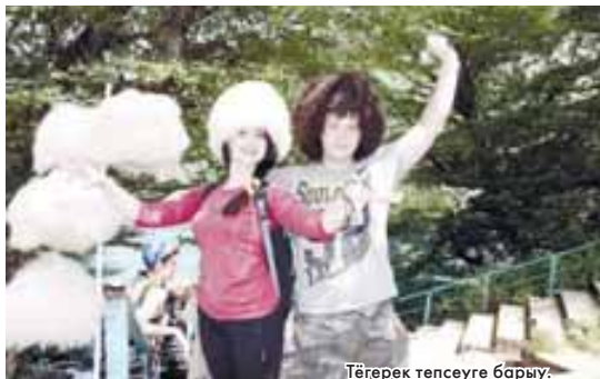
Тёрекегъа төпсеуре барыу.

Алай аланы араларында да сайлау этерге тюшгенди.