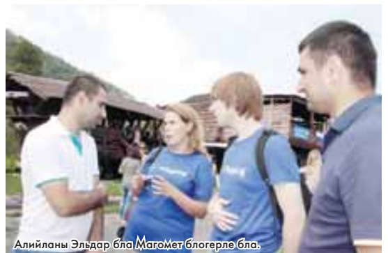
Алийланы Эльдар бла Магомед блогерле бла.

Черек районну Къара-Суу элинде «Содружествоу жаш блогерлерини бла журналистлерини биринчи Тау этношколу кесини ишин бардыргъанды. Быллай проект бу жолгъа дер бир заманда, бир жерде да болмагъанды. Кавказда белгили Холам-Бызынгы тары беш кюнню ичинде дунияны жыйрмадан артыкъ къыралындан келген жюзден аслам жаш адамгъа билимни ёсдюрюну майданына айланганды. Заявканы бергенле уа терт жюзден окъуна кеп эдиле.