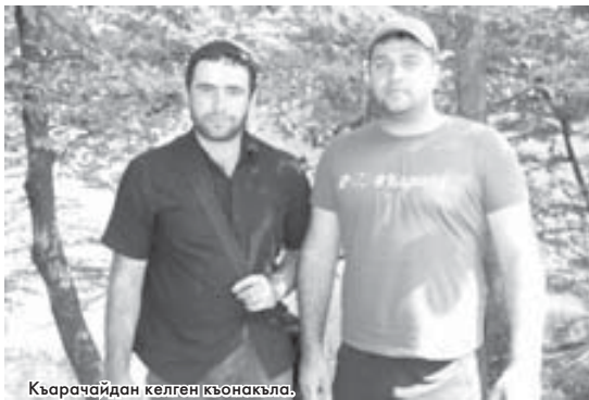
Къарачайдан келген къонакъла.

ле. Битеу анда этген ишлерини юслеринден форумгъа къатышханла Интернетде кеслерини социалстволарында, блогларында, форумларында билдирикдиле, оюмларын жазарыкъдыла.