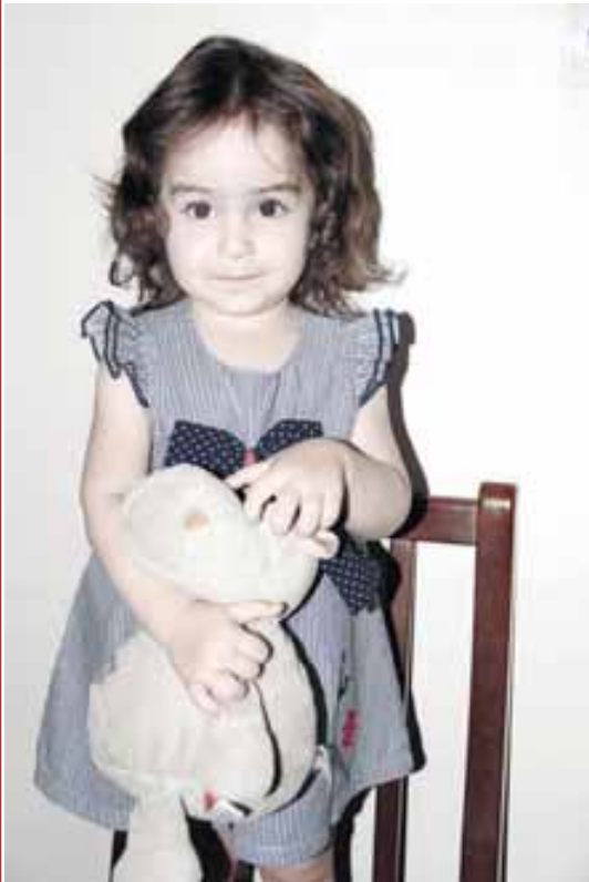
Холаланы Сафиятха эки жыл бла беш ай болады. Кеси да Хасанияда жашайды.