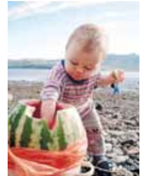
Аны юйге келтирсегиз, бир отуз минут сууукъ сууда тутугъуз.

Харбыз бла жангыз да нитратланы артыгы бла ууланмайдыла. Насыпха, августну харбызларында ала хазна болмайдыла. Алай бу татлы наныкъ кюнде кеп турса, бузулуп башлайды.