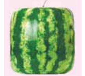
«Комсомольская правда» газет.

Ол а былай болады: харбызгъа «юйчюк» кийдиредиле. Сора ол, кесин энчи болумлагъа жарашдыра, төртгюл форма алып ёседи. Андан тышында, башхалыкъ хазна жокъду.