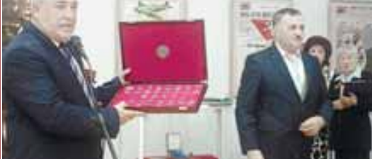
Белгилесича, уруш жылдада искусствону бу тюрлюсю адамланы келгендерде, тууган жерге кертюмчө чакырылду. Жамауат арасында куужу болупманы ачыкылап, аланы кырууда улуу магыналы тутханды. Култура араны кыбартыларында биз кертген плакатла, 1945 жылны Хорламына, жетерге себеп болла, кызауат атыккан адамлага жарык умултарыны юзмөзгө болушанды.