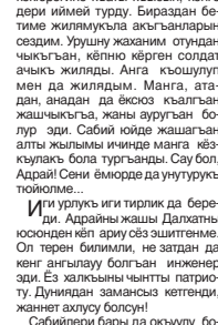
Сурагдан кыарганы бар аруу жашы Мызылы Адрайды. Мени атын аштыте турганына, кеси да көп керектенме.