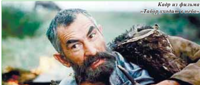
Кадр из фильма «Табор уходит в небо»