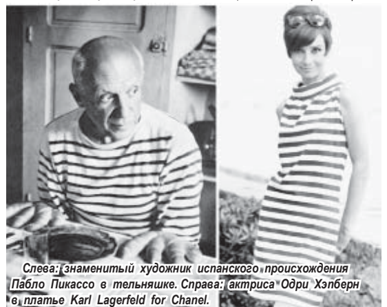
Слева: знаменитый художник испанского происхождения Пабло Пикассо в тельняшке. Справа: актриса Одри Хэпберн в платье Karl Lagerfeld for Chanel.

У одежды в полоску есть еще один аспект, о котором нелишне упомянуть. При-