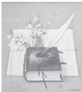
БАБАЛАНЫ Ибрагим Поэтни сыны

жетдирди!.. Энди къайтанса Къоф тауунга, - Бу Чирик кёлюню толкъуну чайпалсын! Кюн ёчюлгюнчю - кёк байрагынг Бу Минги тауунгу башында чайкъалсын! Энди мындаса - ЖЕРИБИЗДЕ! Бу алан халкъынги умуту жангырсын! Энди биргебиз, - жюрегингден Кюнубюз жарысын, жарысын, жарысын!