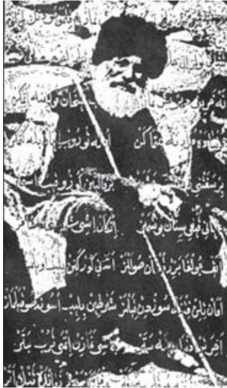
Аллах, кересе, барына тездюк, Барына тездюк, кыайдады тюзлюк? Оггесе, анга кыармай куючюг, Бизге шо кыйынлыккыламы сюзюнг?

Бюгюнлюкде, көп жылла озгандан сора, бегирек ачыккыланады Мечиланы Кязимни