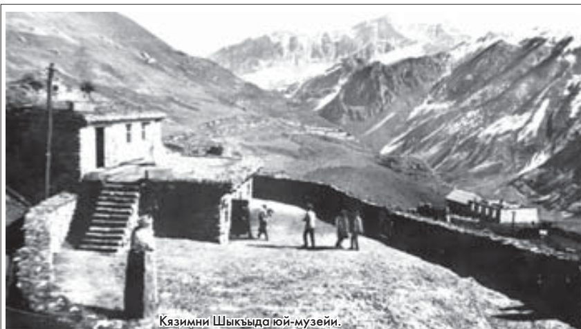
Казимни Шыкьыда юй-музейи.