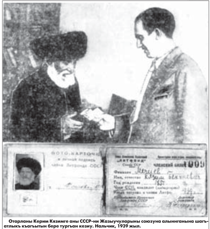
Отарланы Керим Кязимге аны СССР-ни Жазычуларыны союзуна алыннганына шаг-атлыккы кыагытын бере турган кезиу. Нальчик, 1939 жыл.