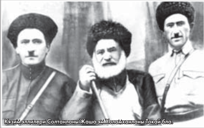
Казим эллилери Солтанланы Жаша эМХолаМханланы Токай бла.