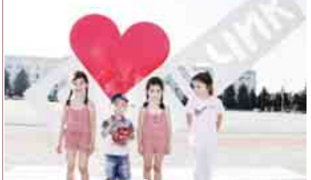
Белгини кьатында суратка тошерге кепле сьйогенди.