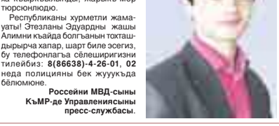
Россейни МВД-сыны Управленийыны пресс-службасы.

Россейни МВД-сыны Элбрус района бөлмюю 1992 жылда 4-чу марта туггун Этезеланы Эдуардыны жашы Алимни из-лейди. Аны регистрациясы бу адресден: КыМР, Эльбрус рай-он, Тарыхчулу шахар, Колхозный тыгырыкында 3-чу юй. Ол 2012 жылда 30-чу марта юйюнден чыгып кетгенди, андан берик кыайдагысы белгисизди.