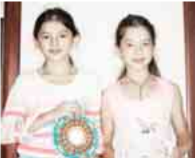
Анда халкыла аралы сабий лагерь болганын мен бытыр билгенме. Ары барырга аладан эркинлик кыагыт керек эди.