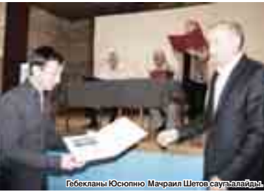
Гебекланы Юсопно Махраил Шетов саулгалады.

Жер участкаланы колешууно шендою жорукьлары жайлыкъланы тийишкиске хайырланууга онг бермейдиле. Саулгъан инкелени, туураланы, койланы, атланы бир жерде