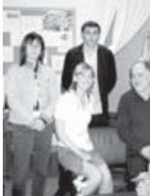
Газаланы Исмайлы Словенияда италияны алим бла.

ламлы ата журтун эми тыш кыралны сынаулары уста хайырланганды, алаг жаны оюмла кыошанды. Алай бла факультуу алим көп торю илму конференциялагы, семинарлагы, илму-интитуу проктелге кыайтырдыкмы, алада доктелде этгенди. Аланы асламысы уа тыш кыраллада - Словенияда, Германияда, Испанияда бардырылганды.