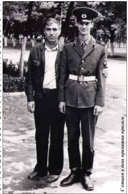
С отцом в день принятия присяги