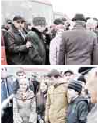
Пресс-служба Главы и Правительства КБР