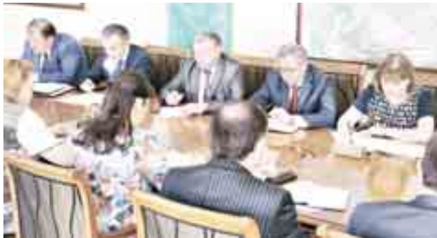
Пресс-служба вице Гавы и Правительства КБР

нуждаются до 70 процентов школ республики. На совещании рассмотрен ряд вопросов, связанных с проведением предстоящих выборов в Парламент КБР, развитием здравоохранения, транспортной инфраструктуры республики.