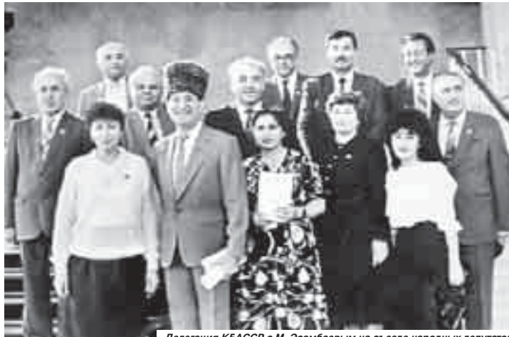
Делегация КБАССР с М. Эсамбаевым на съезде народных депутатов

В начале 70-х на советские экраны вышел художественный фильм «Земля Санникова». Его премьера наделала много шума. Только в 1974 году картину посмотрели более 40 миллионов зрителей.