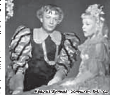
Кадр из фильма «Золушка», 1947 год. редколлегия стальных газет была строго обязательна. Любопытно, что совещание проводилось не в рабочее время, а вечером, в 19.00. Анна ГАБУЕВА

рой представят аппаратуру, сконструированную радиолюбителями республики. Посетителям выставки предложено записать свой голос на целлулоидную патефонную пластинку с помощью звукозаписывающей аппаратуры.