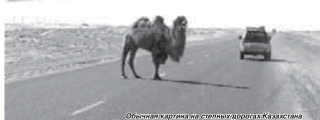
Обычная картина на степных дорогах Казахстана