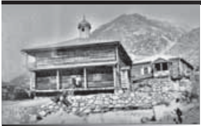
МЕЧЕТЬ В СЕЛЕНИИ УРУСЬБИЕВО 1912 г.