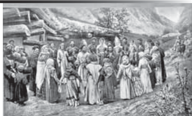
СВАДЕБНЫЕ ТОРЖЕСТВА. СЕЛЕНИЕ ВЕРХНИЙ ЧЕГЕМ