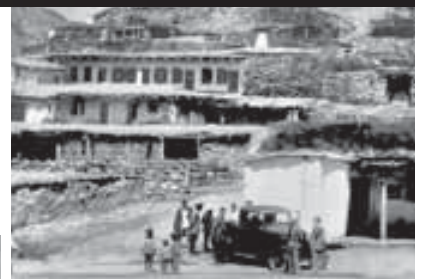
ПЕРВЫЙ АВТОМОБИЛЬ. 1935 г.