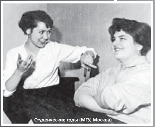
Студенческие годы (МГУ, Москва)

- журналистика, в строке «квалификация» - литературный работник газеты. В газетах довелось поработать недолго. Волею случая или судьбы я попала на радио. И сразу же звучащее слово заворочило меня. Нет, все-таки судьба привела меня туда. Так, радиожурналистика стала моим делом на долгие тридцать шесть лет.