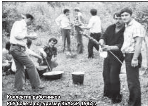
Коллектив работников РСУ Совета по туризму КБАССР. 1982 г.

Однако для тех, кто запечатлен на этих фотографиях,