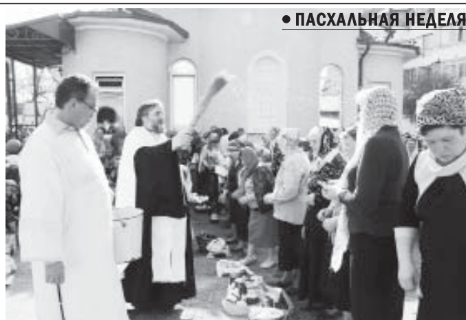
Празднование Пасхи в церкви Симеона Столпника в Нальчике.