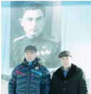
Газаланы Залим бля Мухтар.

адамларыбызны унутурга жарамайды. Есюп келген телелени ма аллайлыны колголеринде юйрөтирге керекби. Бу ишле уа анга себеплик этедиле», - дегениди ол. Байсыланы Темиржан а бейла эришуле адиланла биркирдегилери белгилеп айтаанды. Ала терге айланса иги болулгун чөртөндү.