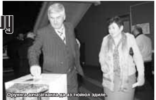
Оруннга ахча атханла да аз туюл эдиле.

Ма ол кезуге Тетууланы Хадисни башламчылыгы бла «Къайсыннга жюз атлам» деген