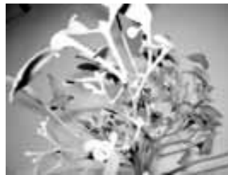
Атына уа «жалгъычы» дегенди.

Кёп заманны ичинде терекледе жабышып ёсуючу бу жашил чомпалны атын тапмай туруп, 70-чы жыллада Ботталаны Даутха да сордум. Аны айтханы уа былай эди: «Аланы акъ чакъгъанчыкъларын мен кыбып да кёргенме, ачыдыла, уллудула деп да айталмайма. Жараны терсейтмеучюлерин да билеме. Юч-тёрт чапыракъчыгын сууда къайнатып ичиучюлери да эсимдеди.