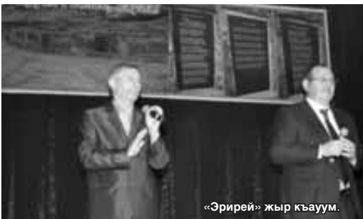
«Эрирей» жыр къауум.

ланнганды. «Къайсыннга жюз атлам» деген проектти жашауда бардыргъанла аны ючюн деп бу кюнледде концерт да кырагъандыла. Анда жыйылгъан ахча толусунай мемориалны кырулушуна кыоратыллыкъды.