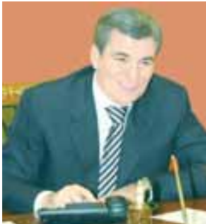
А.Б. Каноконву Рамазан айыны бошалыуу бла алгъышлауу атын ишлеуноден толсунла, юйлеригизде тынчылык, ырахатлык эм монгукту кыларна. Сизге эм сизни ахуларыгызга саулык, насип тежеиме, хар бир огулурлу ишлеригизде жетишимли болуругузу сюеме.

Сизни жюрюктеригиз аруу ниетден эм огулурлукты