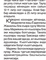
Социалист Урунуну Жигити Эденланды Мариям.