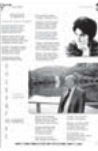
литературага салган кыйынын белгилиди, богонюкюде ол хазанна сакялыганыла да жүркенден