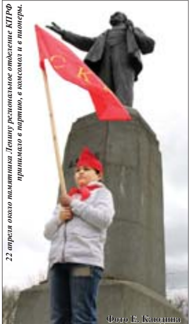
22 апреля около памятника Ленину региональное отделение КПРФ принимает в партию в комсомола и в пионер.

В постсоветские годы в Кабардино-Балкарии предпринималось несколько попыток воссоздать организацию, подобную комсомолу (в 1926 году РКСМ переименован в ВЛКСМ), но заметных результатов они не дали. Тем не менее в майские и ноябрьские праздники на улице можно встретить молодых людей с эмблемами различных молодежных организаций коммунистической направленности.