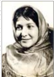
Пробы для фильма «Горняк». 1975 г.