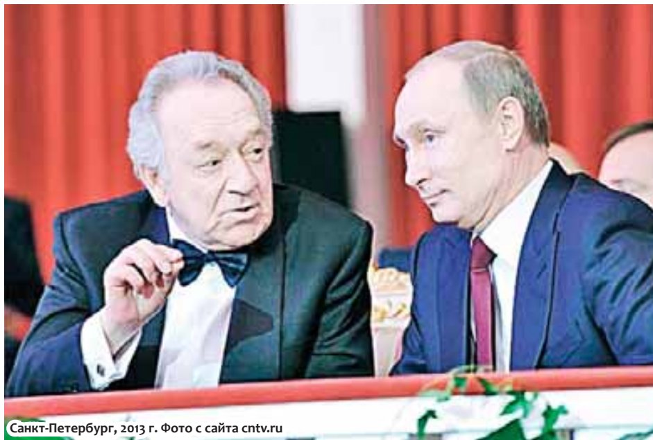
Санкт-Петербург, 2013 г.