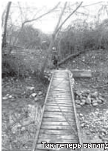
Так теперь выглядит река Урвань

Рыбакам, ловящим рыбу в каналах, часто приходится наблюдать заходящих след за рыбой тюленей. Эти пятнистые красавцы, видимо, привыкли к людям – спасибо за мирное сосуществование человека и тюленя!