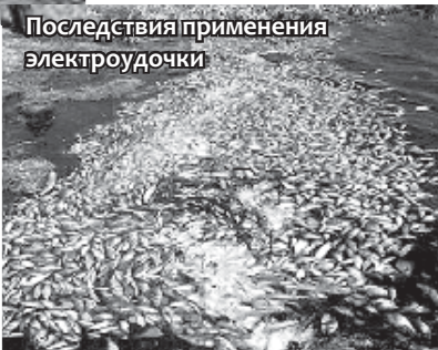
Последствия применения электроудочки

P.S. В Малыгинский родник, на котором обособилось Нартаповское форелевое хозяйство, заходили особи форели свыше килограмма весом. Сейчас этот родник облюбовали шитхалинские электроудочники, и редкая форель успевают добежать до среднего течения этой речки.