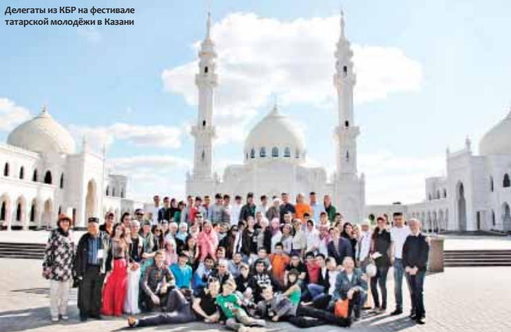
Делегаты из КБР на фестивале татарской молодёжи в Казани

которые надевают по праздникам и другим особым случаям. Татары вместе со всем исламским миром отмечают Уразу-байрам, Курман-байрам, а также осенний праздник урожая и мусульманский новый год – Мухаррам (4 ноября).