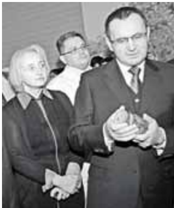
Министр сельского хозяйства России Н. Фёдоров по достижению оценки продукции «Агро-Инвеста»

упаковки конечной продукции, удобная и привлекательная для потребителя как при хранении, так и в употреблении, и третий – способность плодово-овощной продукции, которая должна быть такой, чтобы отпавшие цены обеспечивали достаточную прибыль непосредственному производителю и приемлемые для потребителя розничные цены. Наши консерщики постепенно приходят к пониманию, что в условиях рыночной экономики разумный производитель вряд ли станет работать себе в убыток. Всту-