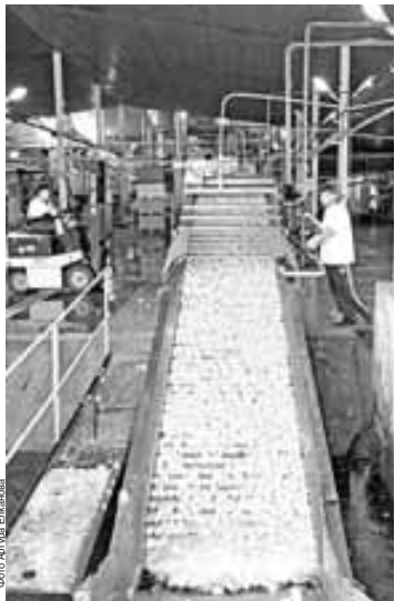
Урожай овощей выдался богатым

упаковки конечной продукции, удобная и привлекательная для потребителя как при хранении, так и в употреблении, и третий – способность плодово-овощной продукции, которая должна быть такой, чтобы отпавшие цены обеспечивали достаточную прибыль непосредственному производителю и приемлемые для потребителя розничные цены. Наши консерщики постепенно приходят к пониманию, что в условиях рыночной экономики разумный производитель вряд ли станет работать себе в убыток. Всту-