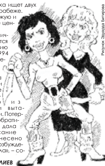
Рисунки: Эдуарда Витирова

ДЛЯ ПОЛУЧЕНИЯ ИНФОРМАЦИИ О НАЛИЧИИ У ВАС ИМЕЮЩИХСЯ ШТРАФОВ ГИБДД