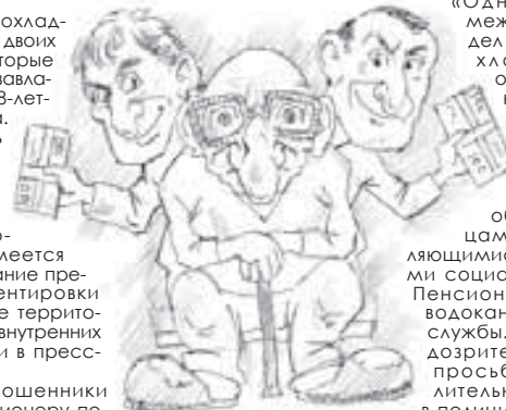
Рисунок Эдуарда Битирова

«Одновременно межрайонный отдел МВД РФ («Прохладненский») обращается к жителям района прояснить по выявленную бдительность при общении с лицами, представляющими работниками социальных служб, Пенсионного фонда, водоканала, газовой службы. Обо всех подозрительных лицах просьба незамедлительно сообщать в полицию», – подчеркнул в МВД.