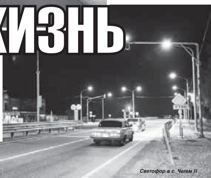
Светофор в с. Чегем II

Как и много веков назад, в современном мире качество дорог и обеспеченность транспортом не только характеризуют состояние экономики, но и являются базовым условием её дальнейшего развития. В настоящее время сеть автомобильных дорог общего пользования КБР составляет 8579 км: 1666 км региональных дорог имеют асфальтобетонное покрытие, 1016 км – гравийно-щебёночное и 225 км – грунтовые. На них находятся 198 крупных искусственных сооружений, в том числе 192 моста и шесть путепроводов.