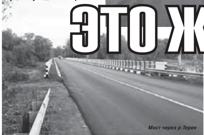
Мост через р. Терек