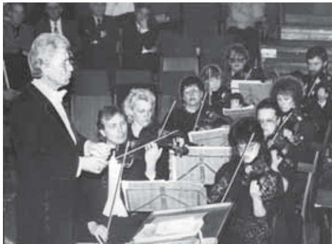
Симфоническим оркестром Кабардино-Балкарской государственной филармонии дирижирует Борис Темирканов. 90-е годы