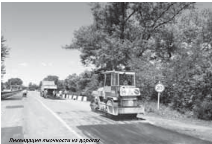
Ликвидация ямочности на дорогах

Одной из приоритетных задач, поставленных Главой республики, является строительство автомобильной дороги Кисловодск – Долина Нарзанов – Джилы-Су – Эльбрус, которое начато в 2008 году. Это, пожалуй, один из самых сложных объектов в новейшей истории дорожного строительства республики, так как работы ведутся на высоте 2500 м над уровнем моря. Автодорога позволит обеспечить транспортную доступность северного склона Эльбруса, в пределах которого планируется развитие туристского комплекса международного уровня. Эта дорога с двухслойным асфальтобетонным покрытием общей протяжённостью почти