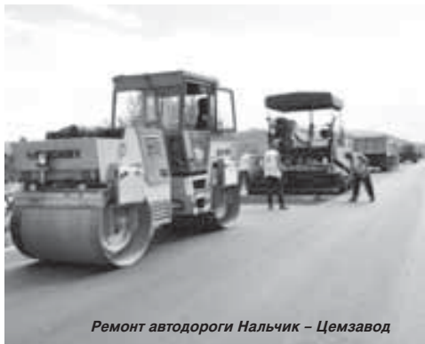
Ремонт автодороги Нальчик – Цемзавод

Традиционно Кабардино-Балкария лидировала по темпам дорожного строительства. Дороги к горным вершинам, к городам и сёлам, мосты, теплотрассы, широкие проспекты – все эти объекты стали визитной карточкой и основой социально-экономического благополучия республики. Задача дорожной отрасли – сохранить и содержать на должном уровне дорожную сеть, а также всячески способствовать её расширению. Существующие показатели деятельности дорожно-транспортного комплекса и благоприятное географическое положение