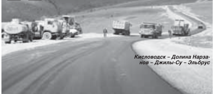
Кисловодск – Долина Нарзанов – Джилы-Су – Эльбрус