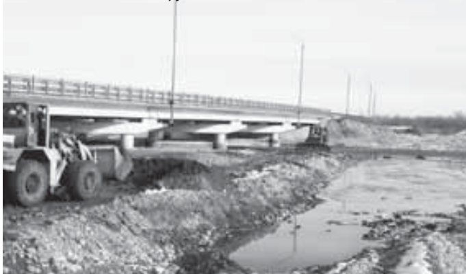
Расчистка подмостовых русел

72 километра должна стать главной транспортной нитью будущего туристического кластера.