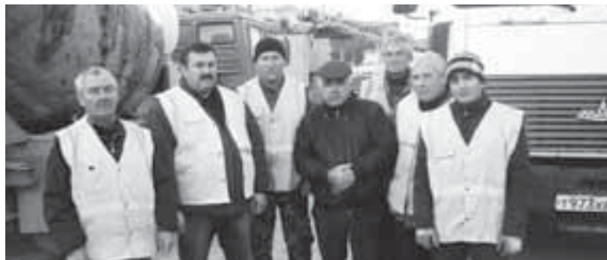
Группа работников Эльбрусского дорожного управления.

Эльбрусское дорожное управление отвечает за состояние муниципальных автомобильных дорог, которые пролегают к социально значимым, туристическим и другим объектам, сенокосным угодьям, горным пастбищам. Их общая протяжённость – около двухсот сорока километров.