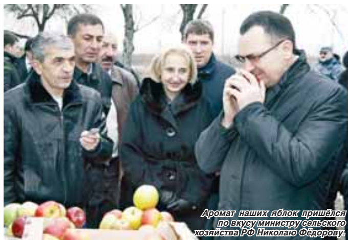
Аромат наших яблок пришёл по вкусу министру сельского хозяйства РФ Николаю Фёдорову.

Важным моментом, который позитивно отразился на развитии сельского хозяйства в республике, стало смещение акцентов в сторону создания комфортного инвестиционного климата именно в сфере АПК. Инвестиции в агропромышленный комплекс КБР на сегодня составили порядка 10 миллиардов рублей. Интенсивный процесс внедрения в