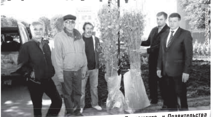
От имени Главы КБР Арсена Канокова, Парламента и Правительства республики в рамках празднования 90-летия со дня рождения Расула Гамзатова жителям Дагестана передано 90 саженцев дамасской розы.