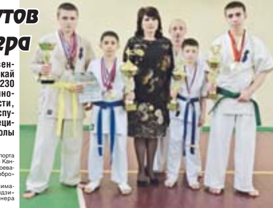
Материалы рубрики подготовил спортивный обозреватель Альберт ДЫШКОВ

В Краснодарском крае прошли первенство и чемпионат ЮФО по клюкусинкай каратэ. В соревнованиях участвовали 230 спортсменов из Дагестана, Кабардино-Балкарии, Чечни, Ростовской области, городов Анапа и Кропоткин. Нашу республику представляли воспитанники Специализированной комплексной спортшколы КБР (директор З. Черкесов).