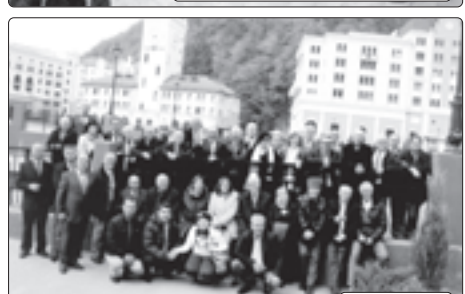
Къалэ дэхэщ Сочэ.

Дэ хьэщхэм дьхуэжыгъэхуэ, я лъыкхьэм, къуэжыгъэхэм хуэдэу дьхьэрагъэблэжыгъуэ. Сгэ фылуэ жьщ лъыкхьэу куэду зэхэт жылагуэу мамыру зэррыщлэпэуныкхьэ, я шьнха-бзэр зэррыщлэпэуныкхьэ куэду арбыхэм я деж шьдэжэ зэррыщлэпэу. Пауэ, а псор хуэзгъэблэжыкхьэм, къэралхэмрэ жылагуээмрэ сыт и лъэныкъуэци къазэрэблэжыкхьэу жылагуэатэмэ. Алхуэдэ политикэ лъыкхьэу дьдэ хуэ-фэцим.