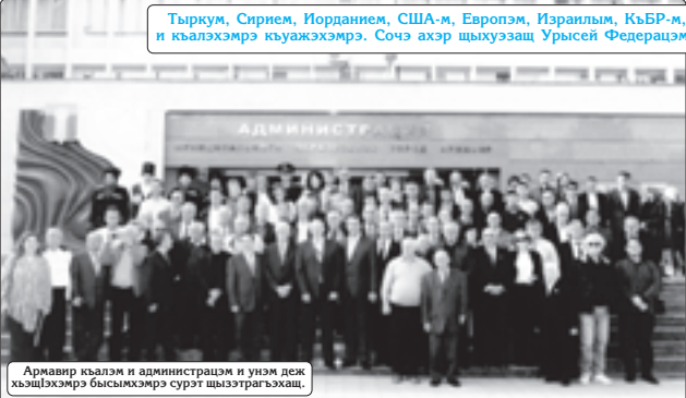
Армавир къалэм и администрацим и унэм деж хьэщхэмрэ бысымхэмрэ сурэт шьэтрагъэхаш.

Тыркым, Сирием, Иорданнем, США-м, Европэм, Израилым, КЪБР-м, Адыгейм шьщ хьэщхэр махуэ бжыгэкъэ шьхьэщаш Краснодар крайм и къалэхэмрэ къуажэхэмрэ. Сочэ ахэр шьхуэзаш Урысей Федерацим и Правительствэм и Унафэщым и къуэдзэ Козак Дмитрий.