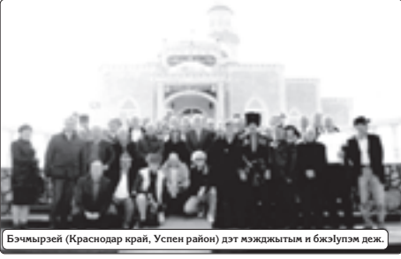
Бэчмырей (Краснодар край, Успен район) дэт мэджытым и бжолупэм деж.