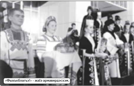
«Фыкхьэблагы» - жалэ армавирдэхсэм.