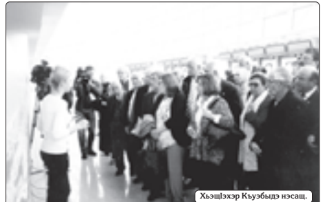
Хьэщхэр къуэблэ нэсаш.

Краснодар крайм, ар езыр шьтти ди къэрал псом и фыпэуи, и шьнхабзэм къыгуэжыпшэ имылуэ шьщ лъыкхьэ шьдрэжхэм я шьнхабзэмрэ тхьэдэ шьщнымрэ. Адыгэхэм папшэ Сочэ къалэм илэ мыхьэнэр къыгуыгуыуахэр, заншэу жысэфынуц шьдрэжэ шьнхабзэм егуэжыну Олимпидэм и программэм хуэфэцим увылшэ зэррыциуыдэ-нур. Дысхуэж шьдэм илэбэсэ, сгэ жагуэу хъуэи, шьхуэ псорри къызгъэнылуэну сыхуиткъым - апуэдэу бьдэу къыгъэуэу Къэрал зэхуэу Олимп комитетым. Ауэ зы вжесэ-фынуц: Сочэ - 2014-м и жыгъэзгъэцэциуэ комитетым и тхьэдэ Черышешев Дмитрий, мы зылушри шьщар, къыс шьхьэуари къысхьэуари Мейсуналэ къалэм, абы школ-лар къышууащ, уеблэмэ, адыгэбзэри шьджащ. Зэрэф-лыгъуэци, ари флэгъунэгъуш.