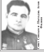
Совет Союзым и Лыхужь, Ачен