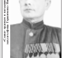
«Славяне ордыным и пилыштырары зыгууэ фотыи» Гаврилов Валентин