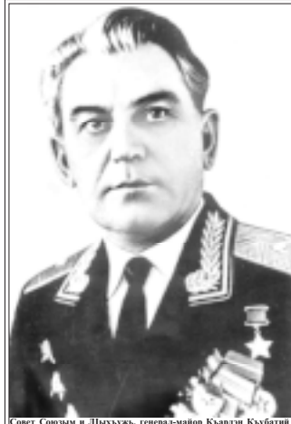
Совет Союзым и Лыхужь, генерал-майор Клубничин