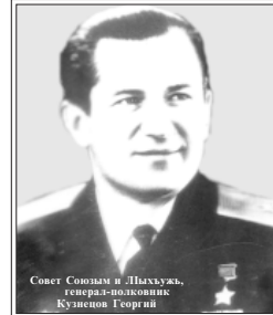
Совет Союзым и Лыхужь, генерал-полковник, Кунисов Георгий