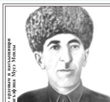
«Славяне ордыным и пилыштырары зыгууэ фотыи» Мухамедов Мухамед