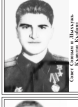
Совет Союзым и Лыхужь, Клубничин

НЭХУЩ Мухэмэд Майм и 9 Мы махуэр ноэ шым и Теклуэныгэм, Игъэхэу лыгъэщангэу екуэжар. Эи деж шыттыгъуу Майм и 9, ун дыгъэрэц Ер зыгъэсынэ зыгуэфыжар. Ун дежш дзэтыгъэгур шыхьым шыгъугуу напуэ Зымыштыгъым зынысыр и кырур. Ун дежш дзэтыгъэгур гъащым и нэхъанэ Ирагъэш Хэкум и шыкугъэ куур. Хуащ илэхэ шэщра тхурэ мамыр гъащэу Совет зауэлым лыгъэкэ кыжар. Укэныгэм тхьым, ар нрокъу кыгъэукуащэ, Блэжым, кыжэуныгэм и шыкы кыбэж ар. Мес, дзурэ зымыштыгъуу кыгъэжыжар. Илэхэжар гуащэдэкикэ зэхэжар. Фо тхьыбэ шалэгъуэ ахэр зыгъэдахэм Хуэмын иэну мамырыгъэ фэи. Ауэ шалэгъуэ зымыштыгъым илэхэ Зыуэлхуэ лыгъэ шыгъахэр шыгъэжар. Сэгъ кыжым фэрэныгъэ зымыштыгъуу шыгъэжар. Ягу кыфэныгъэхэр гуынгъэу куэди. Жыр шыкы кыгуахэр я Блэкстэпкэхэм хэтыжар. Хамыгъыкыгъуу лыгъэ зэрэхар, Къонкыжар я гум я ныбжыгъуу зауэлхуэ Зуэуэлм шыгъэдахуу шалэхэжар. Фашистхэм кыуахэ, кыгуау игъэхэжар Илэрныкы гыуэуэжар гуауэу шалэгъуэр. Сэгъ гуынгъыкы ноэ хуэрей хуэжар. Илэхэ зыуэм шыкы зэримар. А гуауэр ноэи дигу илэхуэ зымыштыкы. А гуауэр ноэи дэ дигу шымыкы. Зауэл кыжэхэм ноэ бэлытоку кыпэжэ, Я илэхэ кыгуахэр нахуэу шалэгъыкы. Кыуэ пэтрин хошыр ахэм я сатырхэм, Игуэуэтыгъэ дзыркуэхэм илэхэ. Ахэм ягуу шланэм, я тэгъуфэ нурхэм, Шалэгъуэ, зымыштыгъуу хуэш гуыныкы Ноэрей махуэр тэрэц илэхэ шыгъэжар... Игъэхэу лыгъэщангэу екуэжар. Эи деж шыттыгъуу Майм и 9, ун дыгъэрэц Ер зыгъэсынэ зыгуэфыжар. 1980 гъэ