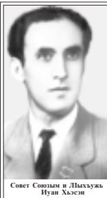
Совет Союзым и Лыхужь Нунан Хэсэи