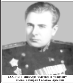
СССР-м и Лыхужь Флотым и унабшу шыта, адмирал Головки Арсений