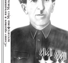
«Славяне ордыным и пилыштырары зыгууэ фотыи» Мухамедов Мухамед