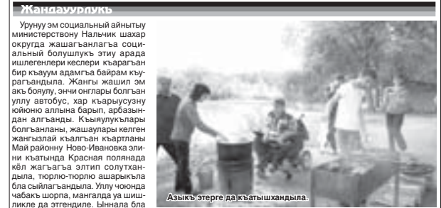
Азыкъ этерге да къатышкандыла.