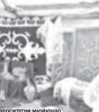
Къарачай-Черкес Къырал университетни молюшо.