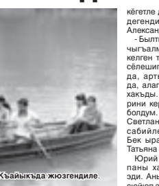
Бир бирлери бѳла халар айтхандыла.

кишилѳе, жаш адамла да кѳгѳге ашыкъмагъандыла.