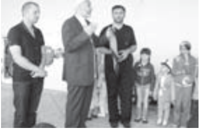
Сабийлени Отарланы Хызыр алгышганды.

Орамда барганла да мында байрамны керселе кьайтып, исламны ариу терелерин керорле. Тюзюн айтханда, халк кьачан жыйлады - нехакда, тойда, бушууда. Исламда жалаңда эки уллу байрам барды - Ораза бла Къуранман - алада уа былай кьуанч бардырғанла жокьдула. Мындан ары уа бу иги юлго жайыла барып деп ушанам», - дегенди Отар ул.