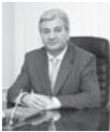
Зур Думаны ишине юсөндөн кесини оюму айтаанды.

- Жаз башы сессияда көп торлюю вопрослагы кырал-ганды. Биринчиден, РФ-ни Президентини башламчылыгы бла айыруу системаны эм кыралны политика кырамыны юсөндөн законаны уллу пакети сюзюлдөгү. Сөз ючөн, «Политика партиаланы юсөндөн» закон жаны организаци-