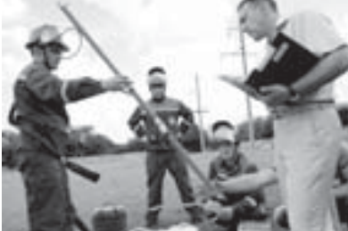
да быллай усталыкыла урунурга келгендиреуге да аслам эс бурлууды.

Регионал аралы сетевой компанияны (МРСК) Къабарты-Малкьарда бөлуюмо командасы «Усталыгына көре бек иги» деген Битероссей конкурсу регион этапна кыташканды. Бөлуюмо пресс-службасы билдиргенге көре, команда «Эм иги электромонтер» номинация экинчи жерни алганды.