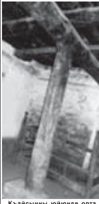
Къайсынын юйюнде орта чигижи.

базык томурулауны бери къылай келтирген бурунла деп сеир этеде. Аланы эпозиле бла тардыргандыла.