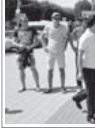
Ейскден кытайхан КЪМКЪУ-ну студент отряды.