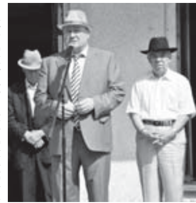
Алай Куйдай улу кетгенликке, аны хар тепсеунде жаны сакланганды, дегенди Черкес улу. Куйдайлары улу тукум болу, орус, къабартлы къарын да бардыла. Жыйылында ала атырлардан белгилу журналист Владимир

Къарачай-Черкесден келген атындан Хубийланы Алий сёлешгенди.