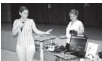
Инвалид сабийлеге оборудовани презентациясы.

Нальчик шахарны экинчи юйюрли лицейинде инвалид сабийли жетишилми окур ючөн, жангы амаллагыа бораланган регионун семинар болганды. Анга Ингушетиядан, Север Осетия-Аланиядан эм КЪМР-ден специалистле кыташканды.