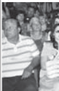
Содууларын тынгый тынгаладыла.

эмюрню музакъасындан башлап, алгга Каччинини бир кыруу чыгарыасын эшитдиргенди. Биз бла Листини романсларын «Бийк сиймеклик», «Кыуач бла бушуу», «Неди сиймеклик» деген эм башхаланы немис тилде жырлаганды. Бизланы барында да толмай кыгалган эм бийк сиймеклик барды», дей эди Образцова. Ол биринден бирине кырауу ала барганын эди, ауазы да