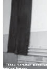
Тёвен Чегемни маданият юйоню болуму.

Мен мында ахыр кере 2004 жылда болганма. Клубну ол замандыгы хали жорегинде артык эл ишленген эдиле. Аны эскилери бир жашдан бери жыйында эди. Болсада бюгонюкде аны фрескы тапды. Алай залын эм кыялы оюларуны а мылылык басылды, ол санда полун да. Ремонт ишлени бардырган бригада азыр азыр азыр азыр орунну бек аман жериклерине жан салып кыюйганды. Грибог а бюгон да андан ары жайыла барады. Клубну терезелери да