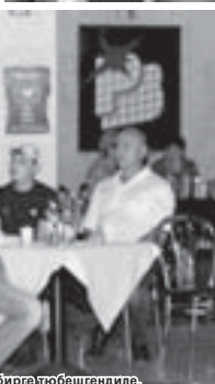
Кыонакбайла, кыонакыла да биргөтүбөшкенди.