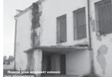
Янкой элни маданият юйоню тыш керюмдосо.

ланьыргыты белгисизди Андан ары жол Огары Чегемге эри. Анда бюгонюкде Эл Тюркюкде бла Бултурда эки клуб ишлейди. Биринчи Чегем сууну жагысында орналыды. Аны тегереги тап халда болганын бизи бек келгендирди. Алай аны ичинде болуму уа жарсылу эди. Эски шеникте, тозураган кой топ бла сахна, ашик, терезе да кез кыуанырга тойюп эдиле.