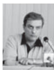
Уголовный ишлери сюдге ѳтдюрюлюкюлде.

КъМР-де Ич ишлени министрствосунда бу кюнледе бардырлган брифингде сѳз зорлыкъ бля, ол санда сауутну хайырланы этилген амалькы ишлени юсеринден баргъанды. Къабарты-Малкяр Республикада МВД-ны Уголовный кодекс управленисыны таматасыны орунбасары полицияны полковникни Вадим Салказанов 2012 жылны биринчи жарымында инсанга зорлыкъ этиу жаны бля амалькы ишлени саны 20,2 процентге аз болгъанды дегенликте, аны бля бирге уа ала битеу амалькы-къланы 3,5 процентин тутханларын чертгенди.