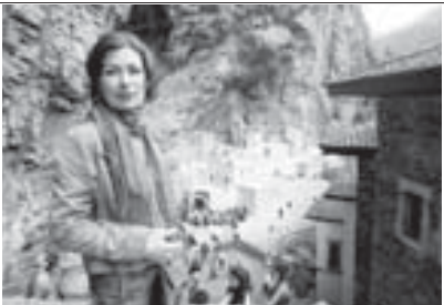
Абайланы Асият монастырьде.

бизни посольствоубундан, Турцияны правительствосундан кырал кылуучуна, андагы культураны белгилуу адамлары көз-кылак болгонлай тургандыла. Ресторанд олтурганбызда, бизни студенткаларыбыз лезгиникти көрсөткөн эдиле. Не десек да, тюрк Кыбаргы-Малкюрдан чыгып-гыйла, башка адамданы бизге сейилери миллет культураны да байламдыла. Ана тилинде