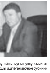
КъМР-ни Башчысыны бла Правительствоуна пресс-службасы.