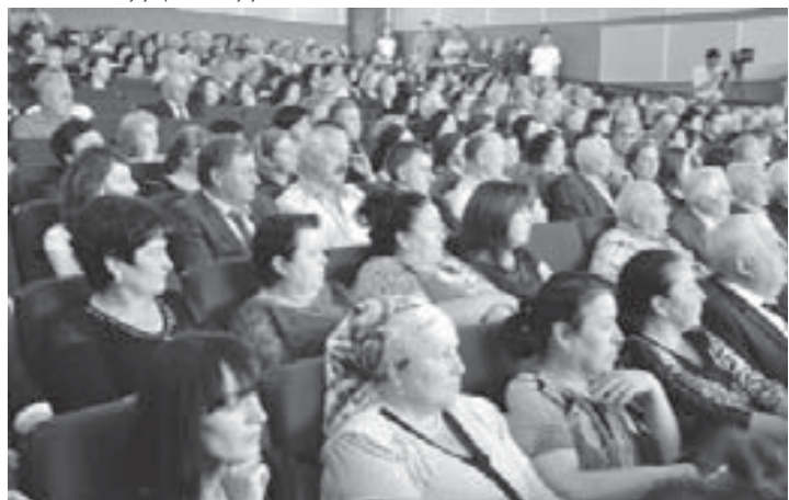
Кыуанчылы жыйылуугъа келгенле.