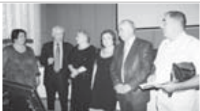
Жыйылууга кыташханлы кыуууу.

тынгылы айтыра специалист болмаганын аңгылагыт, ол борчу менден эсе аны жашау эм уруну жолун тынгылаарк билгелеге кыюма, алай кесим а билини не жаны бла да ишери бюгон да маганылы болганын, алааны юсю бла алыкка келге ахшы тиюлте бардырырга болукъларын айтырга сюеме, дегенди. Андан сора КЧГУ-ну ректору конференцияга жиберген алгышлайу телеграмманы окуганды.