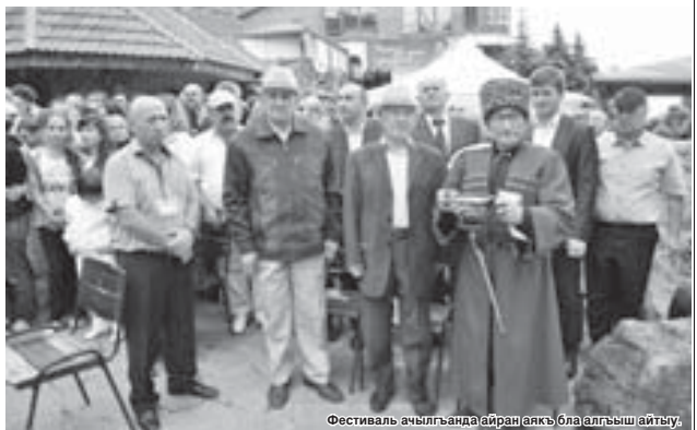
Фестиваль ачылгъанда айран аякъ бла алгыш айтыу.

Биринчи июльда Къарачай-Черкесияда «Бал чучурунда айраны байрам» деген реги-оналы фестивал болганды. Аны «Бал чучуру» деген турфирма, Къабарты-Малкъарны предприниматель тийишуле-рыны Биритюу, Гитче-Къарачай муниципальный району адми-нистрациясы къураганды.