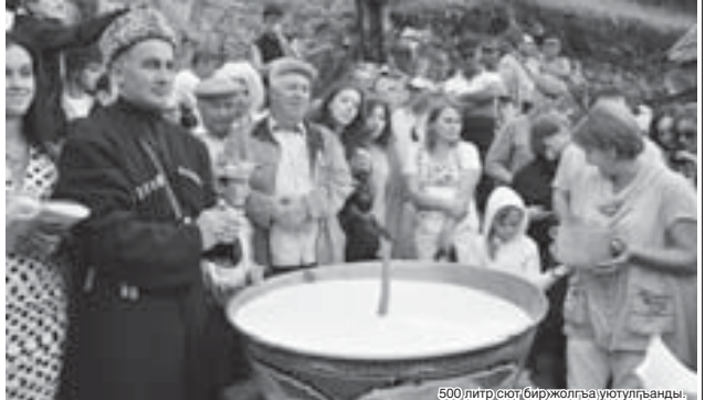
500 литр сют биржолгъа уютулганды.