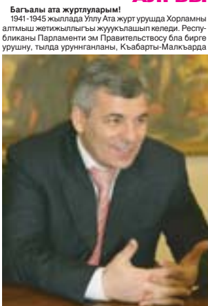
жашагъанланы барысында да бу сыйлы эмда жарыкъ байрам бла жогеримден къызыу алгышлайма.

Кесиги, юююрлериги да насылып болугъуз, мамырыкъда тынч-ырахат жашау этиги!