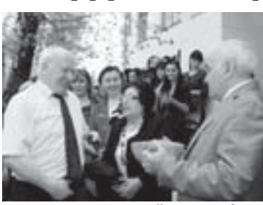
Кыонакыла тобегени кезму.

20-чы апрельде КыМКУ-нун педагогика колледжи Дагыстанны Буйнак шахарыны Расул Гамзатов- ну атын жююротен педагогика колледжинде адамданы кыонакыга алганды. Аладан Кыбарты-Малкырга окуу юкюю директору алы преподавател эм жыйырма юк студент келгенди.