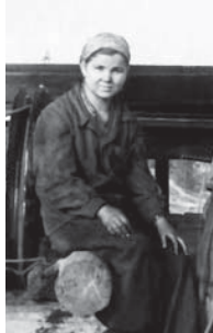
Онг жанында Къазакъланы Кезибан шакъта негери бла.