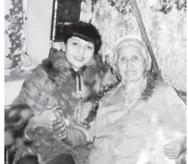
Кезибан оруслу къонагы бла айтды: