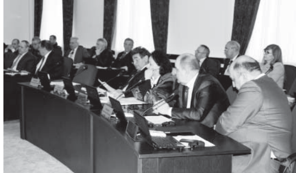
Макарваны Парламентини Сыйлы грамотасы бла сау-саларгъа оюу этгенди.