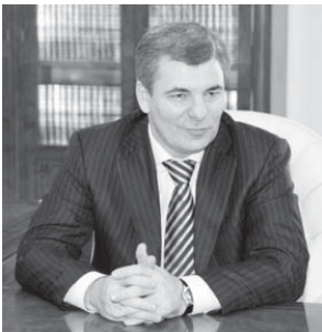
борчлудла эм бизге - регионлары башчыларына - къыралны социальный-экономика политикасын андан ары быдырыругъа болушукъ этерге деп турма.

«Правительствода ишлерикле бир команда болуугъа, Президентге не заманда да билеклик этерге