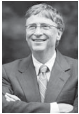
КОМПЬЮТЕРХЭР КУЭД ХЬУАЩ