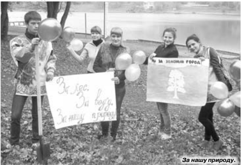
За нашу природу.

Начало было положено утром на берегах Комсомольского пруда. Здесь, ведомые главой администрации Ставрополя Андреем Джатдоевым, собрались известные люди – члены Общественного и Экологического советов при администрации города, депутаты из разных фракций городской Думы. Взоружившись шанцевым инструментом, они – представители властных структур, руководители предприятий, организаций, учебных заведений, лидеры духовных общин и общественных формирований, в том числе протестных – принялись дружно и, как говорится, с огоньком увеличивать число зеленых насаждений.