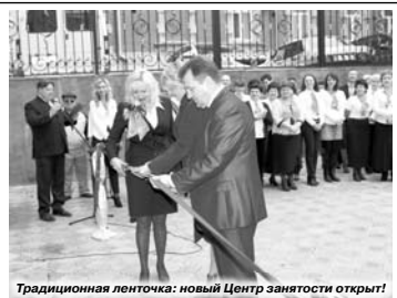
Традиционная ленточка: новый Центр занятости открыт!

Работа «Клуба ищущих работу» будет проводиться психологами Центра занятости в специальном кабинете для групповых занятий. Он оборудован всеми необходимыми техническими средствами, имеется возможность работать в Интернете.