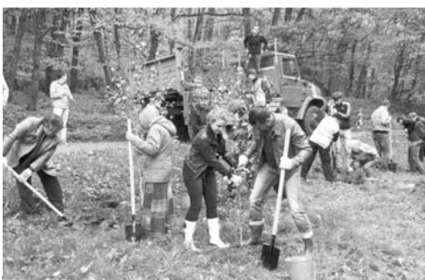
Работа в самом разгаре.

Бок о бок с ними работали жители Ставрополя, откликнувшиеся на призыв администрации краевого центра и городского общественного Экологического совета. Среди участников акции выделялись юные волонтеры – защитники природы, которые здесь представляли студенчество Северо-Кавказского федерального университета. Ребята и девочки заранее