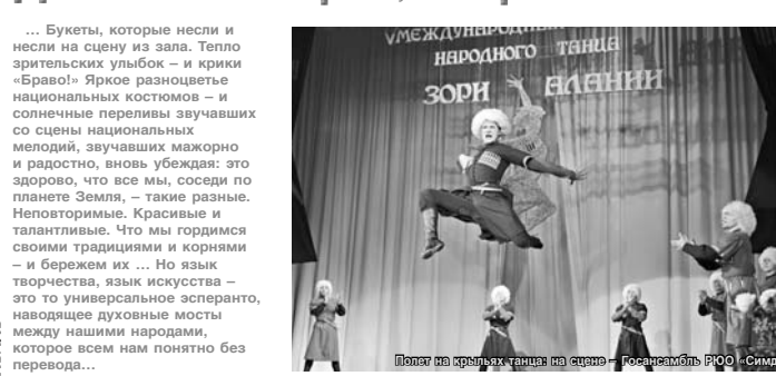
Позов на крыльях танца на сцене - по приглашению РГО «Симла»

... Букеты, которые несли и несли на сцену из зала. Тепло зрительских улыбок - и крики «Браво!» Яркое разноцветье национальных костюмов - и солнечные перемены звучавших со сцены национальных мелодий, звучавших мажорно и радостно, вновь убеждают: это здорово, что все мы, соседи по планете Земля, - такие разные.